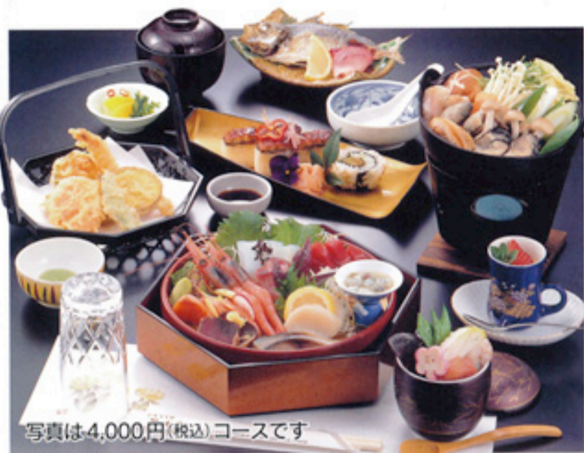
写真は4,000円(税込)コースです