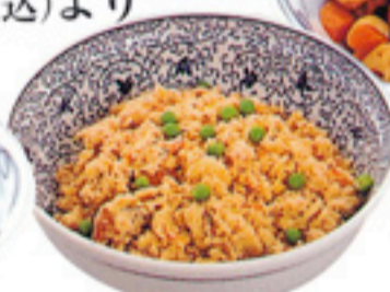
● おから 2,100円(税込)