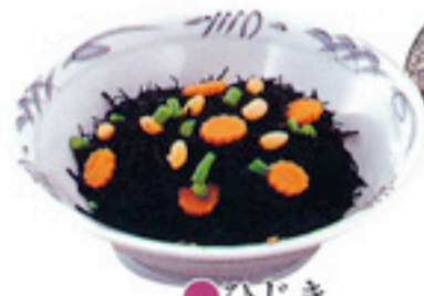
● ひじき 2,100円(税込)