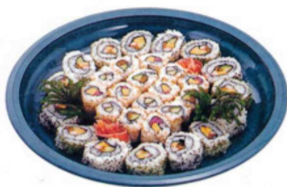
◆ 細巻き寿司(5人盛) 2,500円(税込)