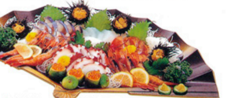
◆ 刺身盛り合わせ ▲写真は、各5,250円(税込) 5,250円~10,500円(税込)