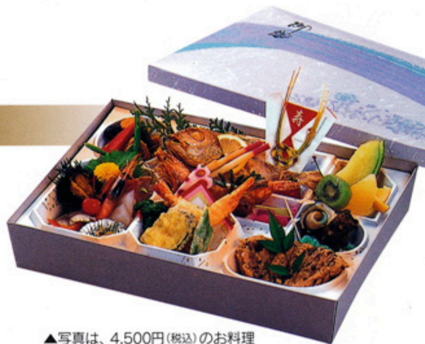
▲写真は、4,500円(税込)のお料理