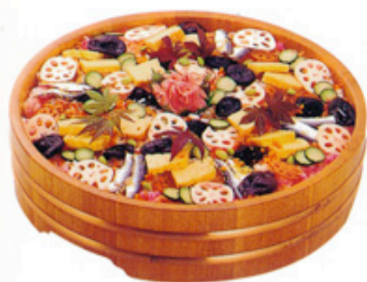
◆ ちらし寿司盛り 3,000円(税込)

大勢の人が集う時、気軽につまんで食べていただける盛り合わせ。 お忙しい会合の席で、とても喜んでいただけるお料理です。