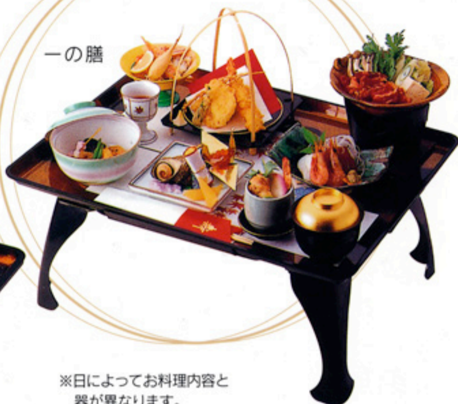
※日によってお料理内容と 器が異なります。