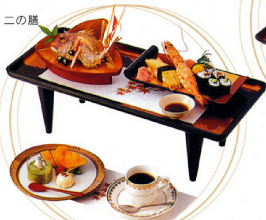
▲写真は、7,000円(税込)のお料理