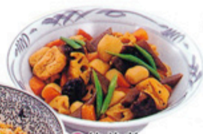
● 筑前煮 2,500円(税込)