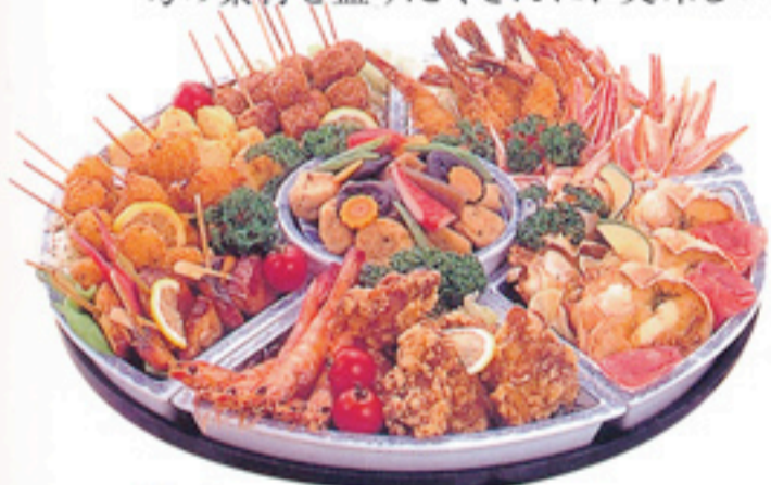
◆ オードブル ▲写真は、8,400円(税込) 5,250円~10,500円(税込)

刺身、オードブル、煮込等パーティーや会合の席にピッタリの盛り合わせ。 旬の素材を盛りだくさんに、美味しいお料理をおとどけします。