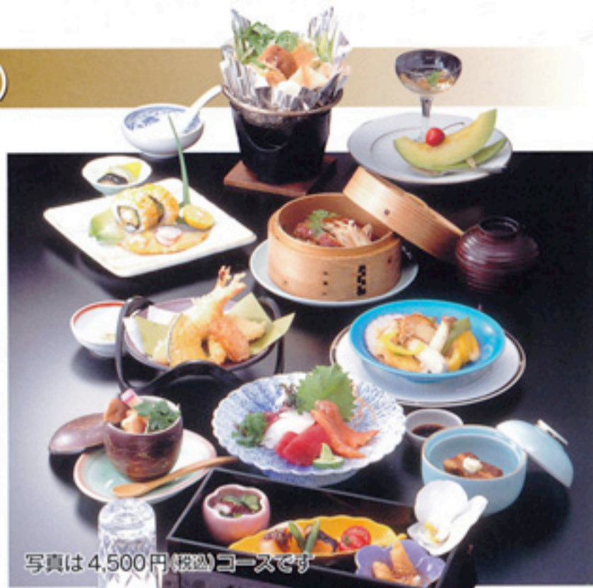
写真は4,500円(税込)コースです