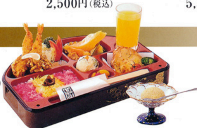
◆ お子様割子 (アイスクリーム付) 1,300円(税込)