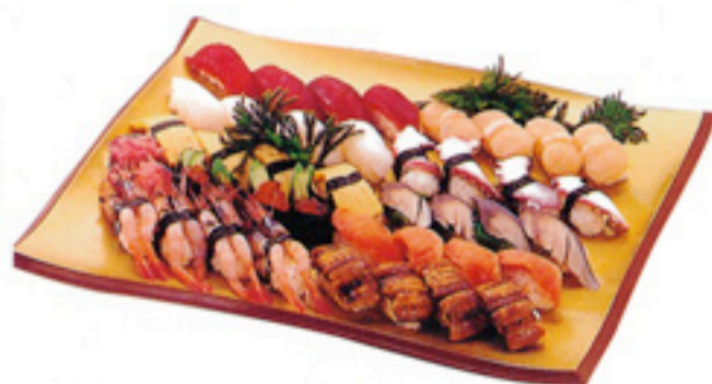
◆ 生寿司盛り合わせ(5人盛) 5,500円(税込)